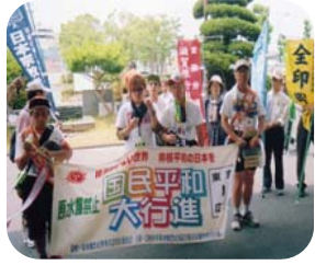
近江八幡市役所前

安土駅から安土町役場へ。役場で議長と町職員などたくさんの方々に迎えられる。町長のメッセージの代読を議長から受ける。同時に町長と議長からアピール署名もいただいた。近江八幡市役所に向かってシユンレヒコールをしたり、歌を流しながら行進。今年は組合からは私一人で行く。女性も4、5人と少ない。太陽も出ているが、涼しい風があるので助かる。昼食も取っ