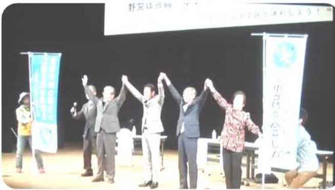
参加者の拍手に応える野党3党代表等ら（9日）