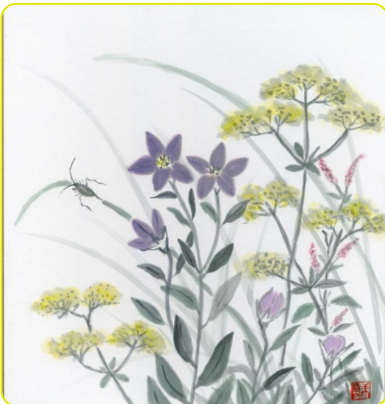
岩波美智子さん 画

支店長が替わりました。今度の支店長は、本部や他の店の人には、ちやほやと気をつかっています。一般のお客さまが長く待っておられるも、パソコンをにらんでいるだけです。何かあると、お客様がおられる前でも、すぐ大きな声で怒鳴りつけます。