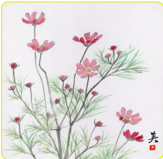
岩波美智子さん画