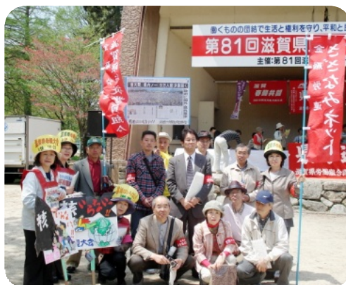
滋賀従組の仲間とともに中央集会会場にて