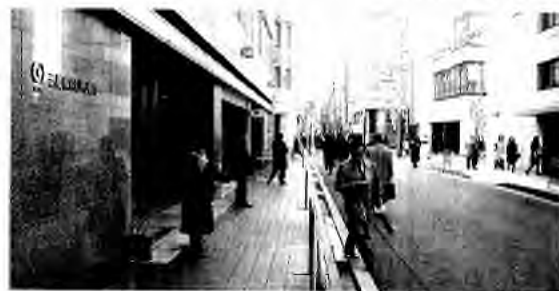
三菱東京UFJ銀行前で宣伝する金融労連と金融ユニオンの組合員=2011年2月、大阪市