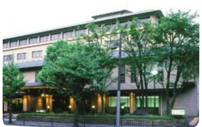
御所西 京都平安ホテルの外観

があります。積極的に参加の呼びかけをし、春闘を盛り上げ、賃上げと安定した雇用で、暮らしと経済を立て直していくことを確認しました。