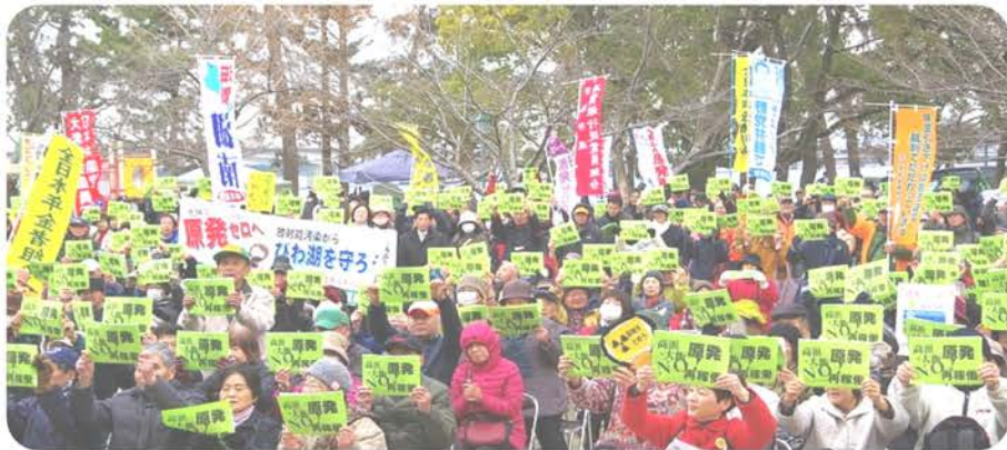
集会で原発再稼働反対をコールする参加者