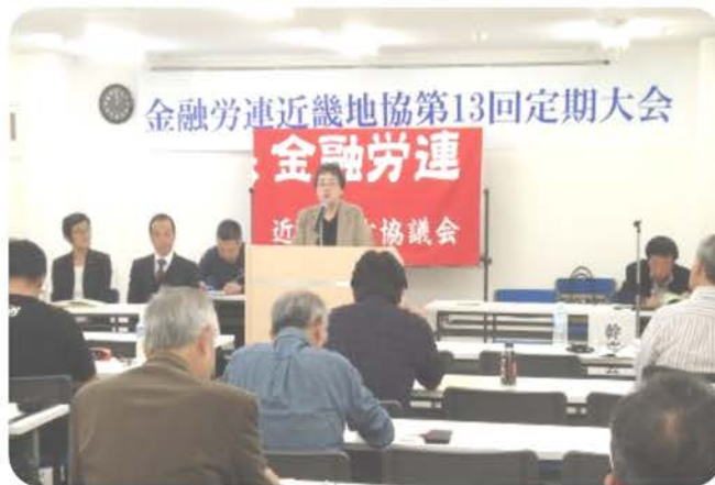
岡野議長があいさつ