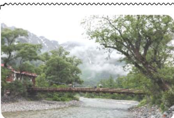
低く垂れこめた雲の合間から除く山々と 上高地のシンボル 河童橋

淡路島は食の宝庫と言われるだけあって、ホテルや昼食の食事は、取れたての魚や新鮮な野菜の料理が多く非常においしくいただきました。