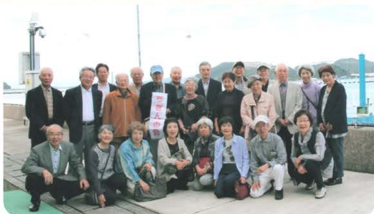
淡路海上ホテルから 福良湾を望む