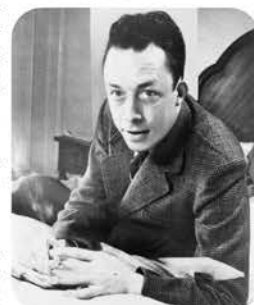
アルベール・カミュ